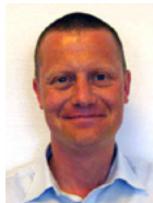
Ole Nørvang-Holm Kurser og efteruddannelse (Køge)

Har du ønsker om andre kurser eller særligt tilrettelagte kursusforløb, så kontakt konsulenterne.