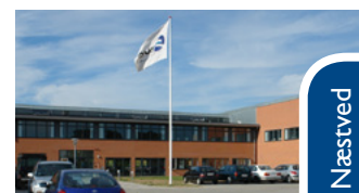
Lyngvej 25C, 4600 Køge