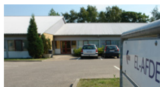
Murervænget 5, 4700 Næstved