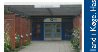
Boholtevej 95, 4600 Køge

EUC Sjælland i Køge, Haslev, Næstved tlf: 55 75 33 00 • www.eucs.dk