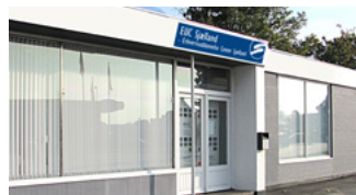
Elmealle 2, 4760 Vordingborg