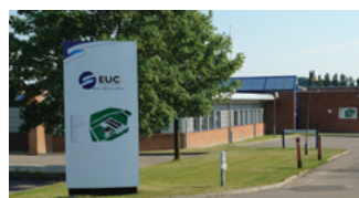
Jagtvej 2, 4700 Næstved