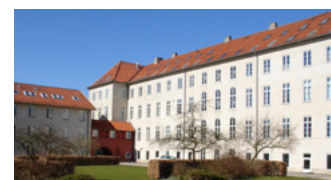
Skolegade 21, 4690 Haslev