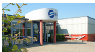
Malervænget 4, 4700 Næstved