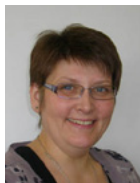
Bente Egede Kurser og efteruddannelse (Næstved)