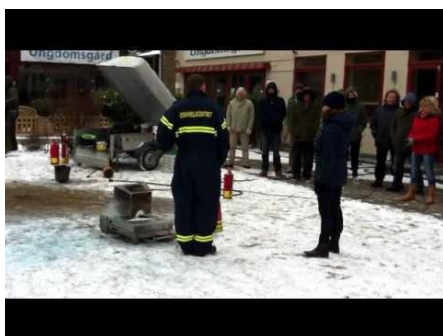
Førstehjælp, mellem niveau (Fagnr. 10851)